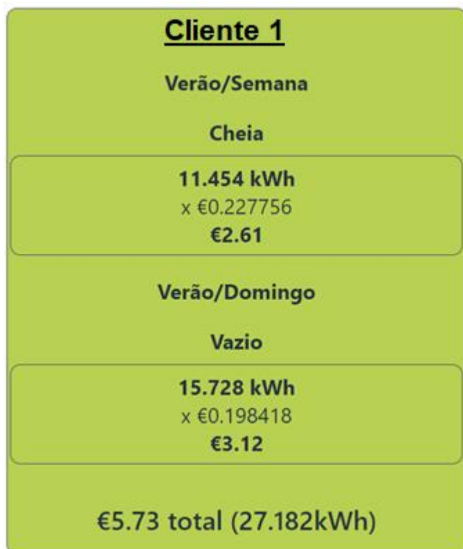
Figura 2 O totalizador dos consumos. Como pode verificar mudou o horário do tarifário de Inverno para Verão e os registos são feitos conforme.

Uma instalação multi-carregador num parque de estacionamento, requer sistemas administrativos e financeiros que suportam os processos do registo de utilizador final até a faturação dos serviços de carregamento no fim do mês. A lei prevê que os valores envolvidos com os custos de energia elétrica fornecida ao utilizador, sejam faturados com as tarifas exatas do comercializador de eletricidade. Uma organização não comercializadora de eletricidade, não pode faturar valores diferentes aos valores do comercializador.